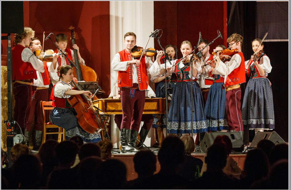
„My zme Valaši, jedna rodina“, Brno, 1. 4. 2023 (společný koncert Kašavy a Javorníku)