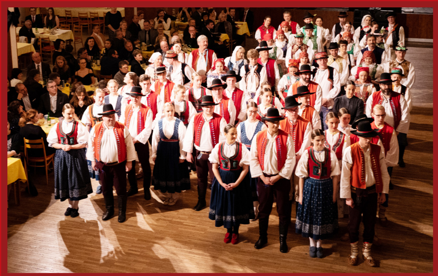
50. valašský bál, Lukov, 4. 2. 2023